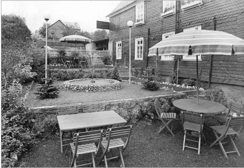
Im Teich auf der linken Seite des Gebäudes fühlten sich Goldfische über viele Jahre heimisch